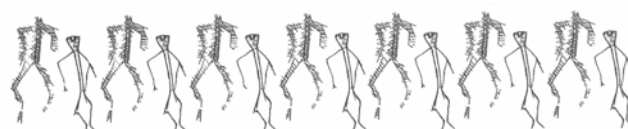
Ristning på bendolk av kronhjortsben, Bökeberg. Nedre bilden är en upprepning av de båda människofigurerna. Teckning: Björn Nilsson.